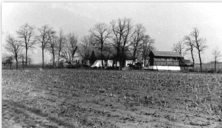
Szállás Bajsa határában

Az ágendások vizsgálja után felhívtam a gyermekeket, hogy törvény szerint mindegyik 50 krajcárt köteles hozni. Nem hozott egy sem. Utána jártam a dolognak, hogy itt ismét valami bujtogató keze működik. Itt is